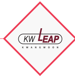
Chosen as Autonomous Contract University for the University Innovation Support Project.