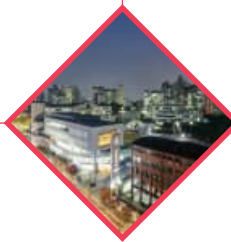
Chosen as Seoul Campus Town Construction Project